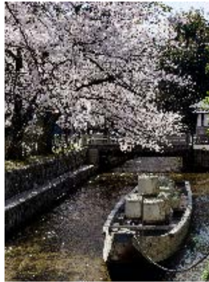
史跡 高瀬川一之舟入

舟運が盛んになり、船頭や旅客向けの旅館や料亭が置かれて発展したが、現在の木屋町通や先斗町通。川沿いには藩邸も並び、幕末には尊攘派の志士が密議を交わす場所にも……。そう、高瀬川は激動の時代のはじまりの地でもあったのです。